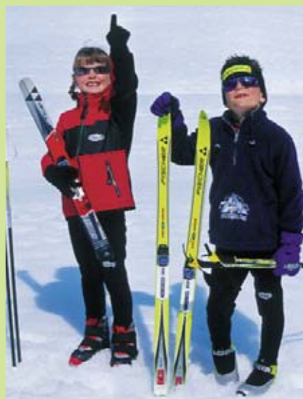
Bei Grüner kommen die Kleinen nicht zu kurz.