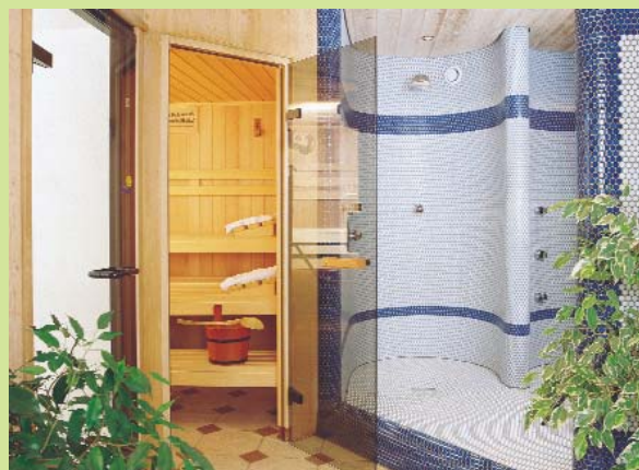
Dampf ablassen in unserer Sauna- und Wellnesslandschaft.

Der Körper kommt auf Hochtouren, den Geist beflügelt ein hochalpiner Adrenalinrausch und das Wachbewusstsein ist so ausgeprägt, dass so manche Nacht zum Tag wird. Damit hat sich der menschliche Zustand eindeutig „gewendet“, zu seinem Besten nämlich. Was nun theoretisch so unglaublich klingen mag, lässt sich praktisch einfach erklären: durch unsere speziellen Winterpauschalen mit Anti-Lethargie-Effekt.