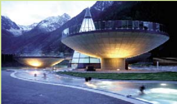
Lust auf ein Bad in der „Champagner-Schale“? Springen Sie hinein!

Energien, in die man eintauchen kann, Lebensgeister, die warmen Dämpfen entsteigen, alpine Gefühle, die bewegende Wellen schlagen – hier ist nicht von Science Fiction die Rede, sondern vom thermischen Jungbrunnen in Längenfeld inmitten der Öztaler Alpen.