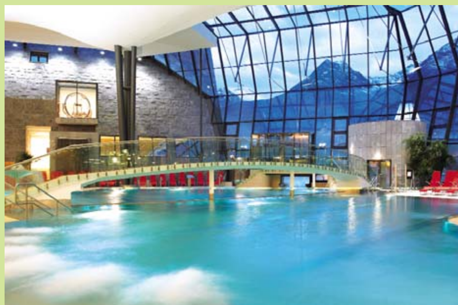
Neue Energie tanken, sich treiben lassen – im Aqua Dome geht das ganz leicht.

Der Alpengasthof Grüner ist ein Partnerbetrieb des Aqua Dome. Daher gibt's für all unsere Gäste 3% Ermäßigung auf den Eintritt.