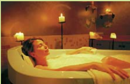
Mit dem Badeöl „Thermentraum“ entspannen.

Sollten Ihnen die geballte Masse an Öztaler Naturschönheit den Blick getrübt haben, hier ein kleiner Tipp für müde Augen: 1 Tropfen Rosenöl in 250 ml kaltes Wasser geben. 2 Wattepaden darin befeuchten. Auf die Augen legen. Die Müdigkeit verfliegt!