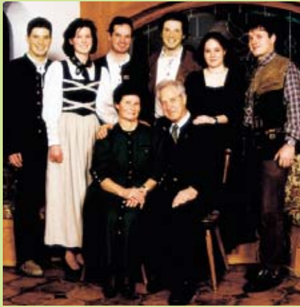
Ihre Gastgeber: Die Familie Grüner.