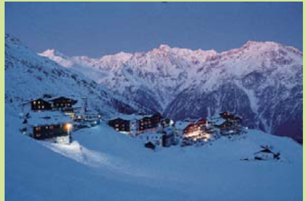
Wintertraum, made in Sölden: Hier hört man Weihnachten nahen.

am Gletscher! Wie der Name schon sagt, handelt es sich bei unserer „Fit in den Winter“-Pauschale um ein richtiges Energiebündel bzw. Kraftpaket. Neben all den stimulierenden kulinarischen