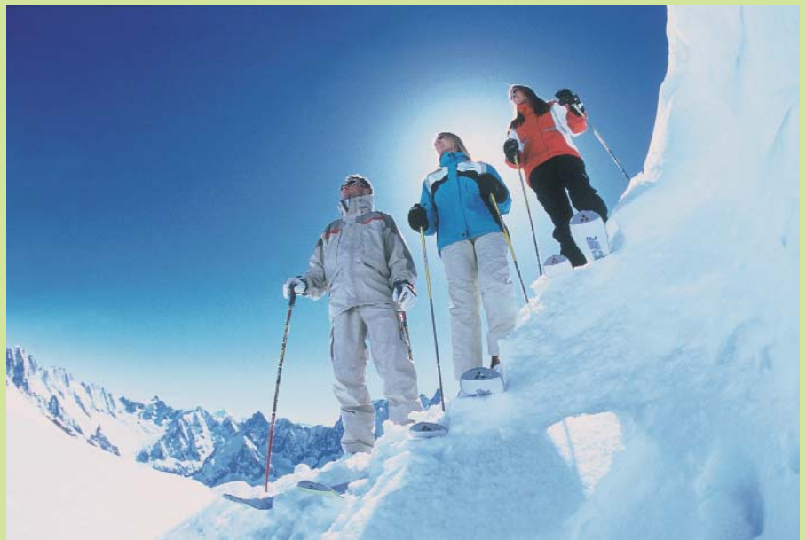
Großartige Momente in bester Gesellschaft, traumhafte Kulissen und glasklare Luft: Sie sind in Sölden.

Früh übt sich, wer ein Skistar werden will. Wir geben eine kleine Starthilfe – unser Alpengasthof liegt nur wenige Meter von der Skischule entfernt. Dort lernen vom Knirps bis hin zum ambitionierten Slalom-Nachwuchs alle in Bestzeit die Basics und die Finessen eines richtigen Carving-Schwunges. Spielerische Methoden und nette, perfekt ausgebildete Ski-LehrerInnen sind das Geheimnis des Erfolges. Und Mama und Papa wissen Ihre Kids in den besten Händen – den ganzen Tag über.