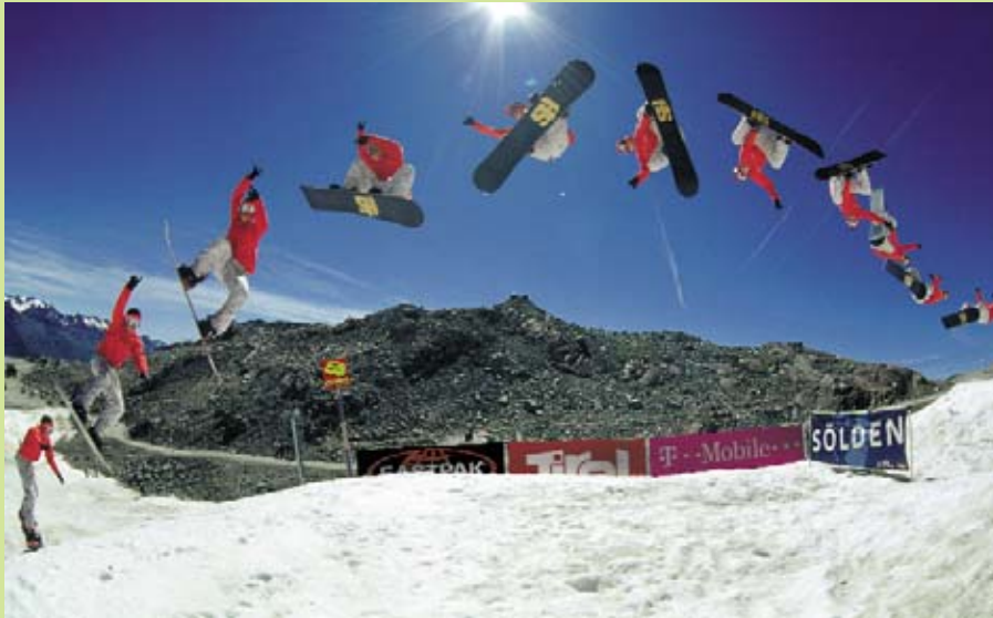
Atemberaubende Snowboard-Action garantiert: Das FIS Snowboard Opening startet am 15. Oktober.