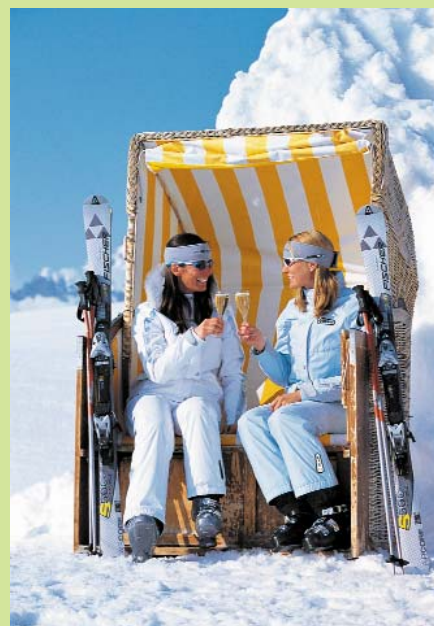
Warum mit dem Après Ski warten?

Ortstaxe pro Person (ab 15 Jahre) und Tag: €1,50.